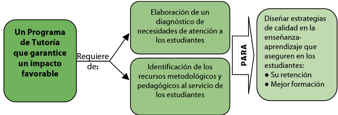
Figura 2. Identificación de necesidades y recurso (Ibid)

Programas de tutoría: desde dónde y para qué